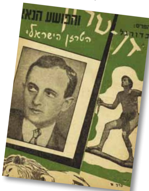
Tarzan mod Eichman, 19??.