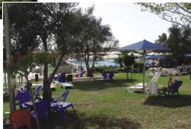
Ramat Rachels bryllupsbaldakin med udsigt over Betlehem (ø.t.v.) og Ramat Rachels sportscenter.

sten, hvor Maria sad. På selve højen har man fundet rester af værelser til beboelse og mosaikker fra endnu en byzantinsk kirke.