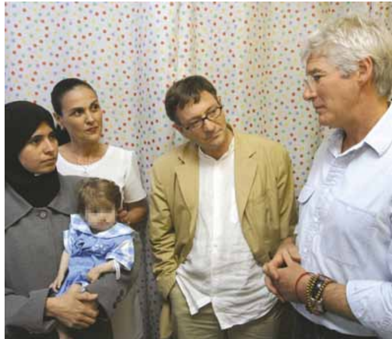
Den amerikanske skuespiller Richard Gere støtter Saving Children programmet.

En måde, hvorpå alle, der føler trang til det, kan hjælpe, kan for eksempel være at donere et beløb til fredscentrets arbejde. Man kan læse mere herom på Facebook under The Peres Center For Peace.