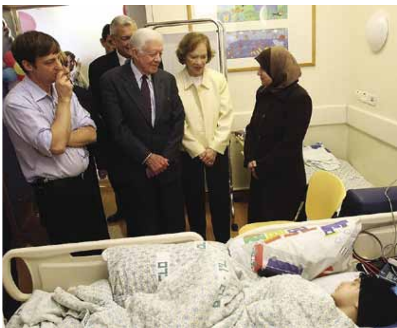
USA's tidligere præsident, Jimmy Carter, og hans hustru besøger Saving Children programmet.

Takket være Medilink-programmet er der senest etableret et børnehospital i Hebron, hvor hele lægestaben er uddannet i Israel.